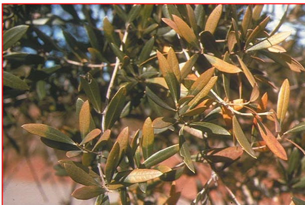
Sintomi di Boro Carenza