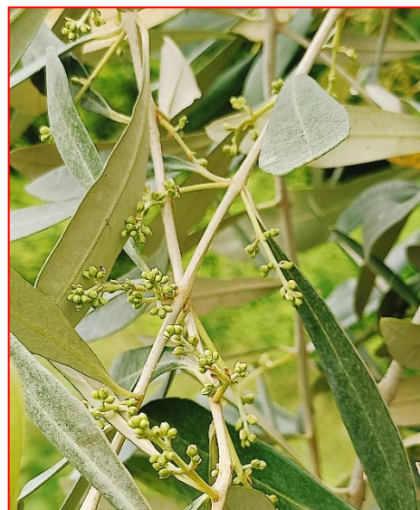
Sviluppo delle mignole