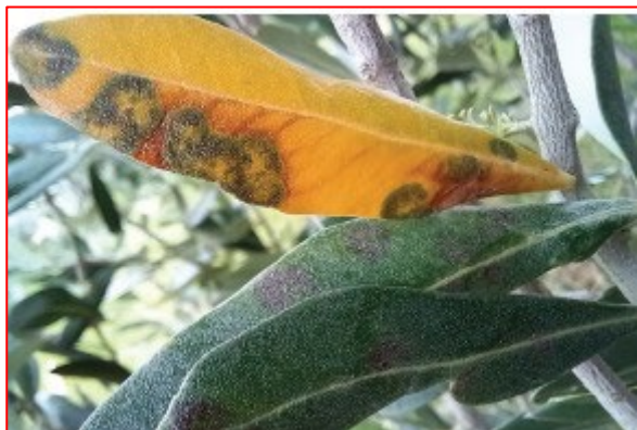
Attacco di occhio di pavone - areale sebino