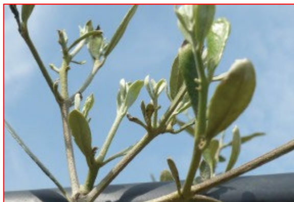
Sintomi di Boro carenza - areale sebino