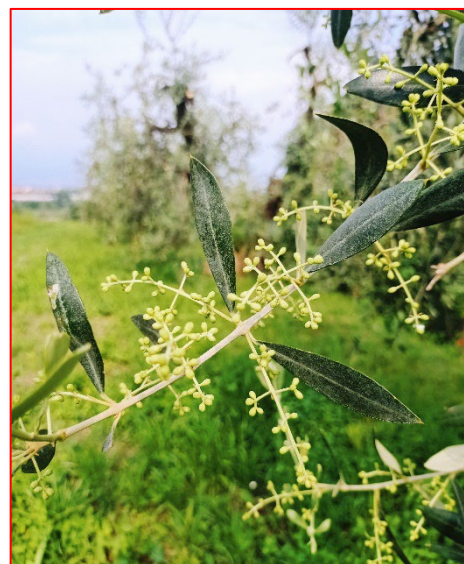
Sviluppo delle mignole