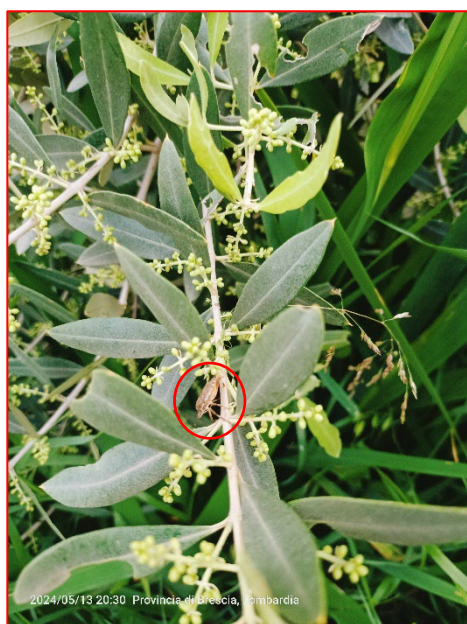
Adulto di Cimice asiatica - Valtenesi

Programma di Sviluppo Rurale 2014 - 2020 Fondo Europeo Agricolo per lo Sviluppo Rurale –Misura 19 - OPERAZIONE 19.3.01 “Cooperazione interterritoriale e transnazionale”